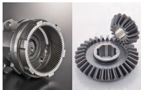
航空機部品 インターナルヘリカルギヤ(左) 防衛部品 ベベルギヤ(右)

多くの皆様にご支援、ご協力をいただき心より感謝申し上げます。時代の転換期にあたり、新たな技術を創造した「ものづくり」を実践すると同時に、人の力を最大限活かし、さらなる強い企業を構築すると同時に、地域経済の活性化に向け努力を続けて参ります。