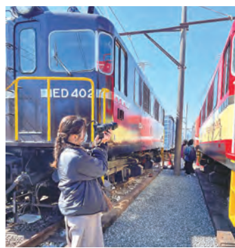
がくてつ機関車ひろば

本事業は、岳南鉄道沿線に点在する寺社やまちの歴史を感じていただき、電車と徒歩においてどのような行程を組み込めるか可能性を探る目的で開催しました。当日は龍水山匠王寺(比奈)と吉原山妙祥寺(中央町)の2カ寺より宗派の教えや史跡などの紹介を受けた後、限定御朱印が手渡されました。また、がくてつ機関車ひろばではレトロ車両の内部を特別見学、吉原商店街においては、魅力ある個店の説明を受けた後、ぶらぶらと商店街を散策しながら寄り道するなど、思い思いの楽しみ方ができた旅になりました。参加者からは、「地元だが初めて岳南電車に乗って楽しみ方が分かった」「御朱印というキーワードから参加し