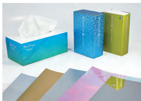
各種特殊加工紙を幅広く製造

この度、はばたく中小企業300社に選出頂き、誠に有難く光栄に存じます。今後もグローバルワークな視点で新たな紙文化を切り開き、社会に貢献できるよう邁進して参ります。