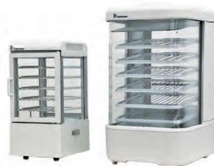
国内初IHフードスチーマー

これからも、時代の変化を見つめながら、最先端の技術技能を駆使し、新しいソリューションを創り続け、さらなる向上を目指して参ります。