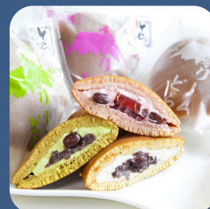
⑪ 生クリームどら焼き 和洋菓子 はせがわ