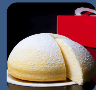
⑫ 富士山スフレ コンデイトライ東洋堂