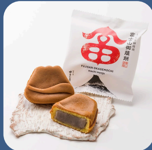
② 富士山御蔭餅 株 田子の月