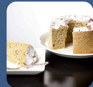
⑧ 抹茶シフォンケーキ コンデイトライ東洋堂