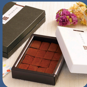
⑥ 生チョコ(根方街道石畳) 菓道 KANSEIDO