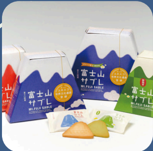
① 富士山サブレ 富士製パン(株)