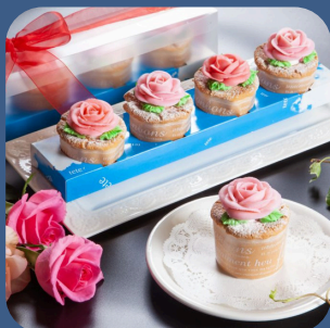
⑭ バラのあんぱんケーキ tete(テテ)