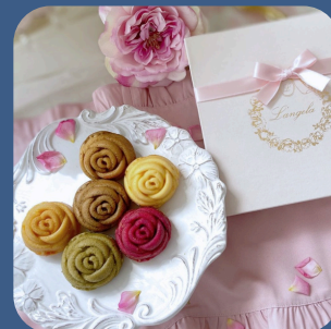
⑦ バラのマドレーヌ ランジェラ