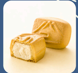
④ ふじのくに 株 田子の月