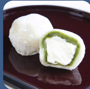
③ 抹茶生クリーム大福 和洋菓子 はせがわ