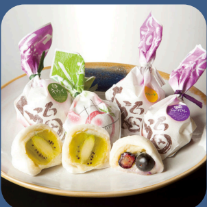
⑬ フルーツ大福 菓子処たかぎ