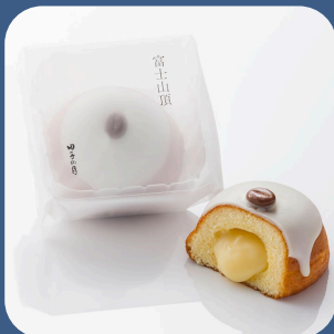
⑤ 富士山頂 株 田子の月