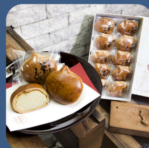
⑩ 栗まんじゅう 御菓子司 南岳堂