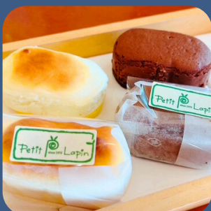
⑨ 超半熟 富士山麓 プチ・ラパン