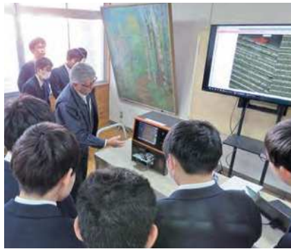
明産(株)による厚さ計のデモ

きの声が上がりました。また、OBの一人は同社に籍を置きながら静岡県立工科短期大学校に通っていることが紹介され、人材育成プランにも関心を集めていました。当所では、吉原工業高校OB・OGから働くことについて学ぶ「キャリアカフェ」をはじめ、同校の維持・発展に向けた支援を継続して実施していく予定です。