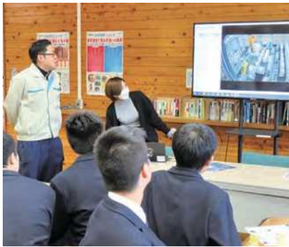
作業映像を解説するOB(株)富士ロジテックHD

去る12月17日(火)、第6回キャリアカフェを吉原工業高校で開催しました。今回は(株)富士ロジテックホールディングス(倉庫業)と明産(株)(スリッター機械・厚さ計製造販売)の2社が参加し、両社に勤務する同校OB・OGがどのような職種で活躍しているかを聞こうと21名の生徒が集まりました。