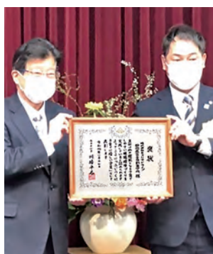
川勝知事より褒状が授与された

に恥じないように、一層このような取り組みを促進し、すべてのお母さんの『働きたい!』を叶えていける会社になりたい』とコメントいただきました。