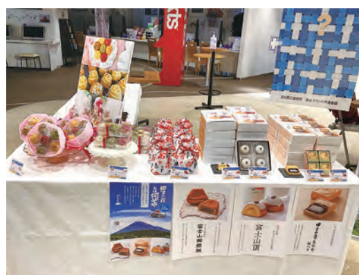
販売した認定品の一部