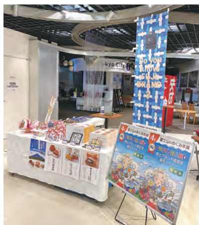
PR展の富士ブランドブース

今回のイベントではお菓子をはじめ、調味料や製品の販売を行いました。多くの方にお手に取っていただき、富士地域ならではの「産品」「製品」のアピールをすることができました。両日ともに10時から18時までのイベントでしたが、平日にも関わらず、様々な年代の方にご来場いただきました。認定品を購入された方々からは「地元富士のものを東京で買うことができ嬉しい」「富士にこのような産品や製品があることを知らなかった」などの声が寄せられました。