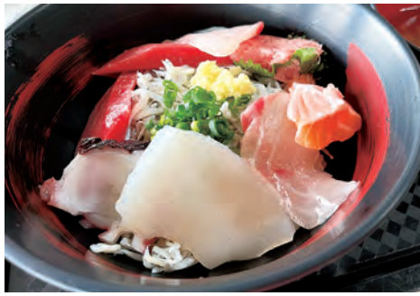
ブランドスタッフのオリジナル海鮮丼

地元のロックバンドや吹奏楽団の音楽が響き渡る市場では、漁協食堂によるしらす丼に好きな刺身を盛り付ける今回の目玉の1つ「オリジナル海鮮丼」が提供され、1日で430食を売り上げた他、市内の事業者ら14店が飲食や雑貨を販売し完売を出す店も出るなど、多くの方に富士市のグルメを堪能いただきました。