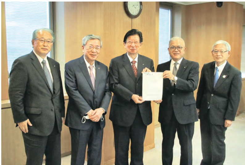
県内15商工会議所会頭が川勝県知事に要望

県では制度融資の利子補給制度が用意されているが、さらに一歩進め、事業用の電気自動車等、外部給電器、V2Hの購入・リースした場合の上乗せ補助金が創設されるよう要望する。