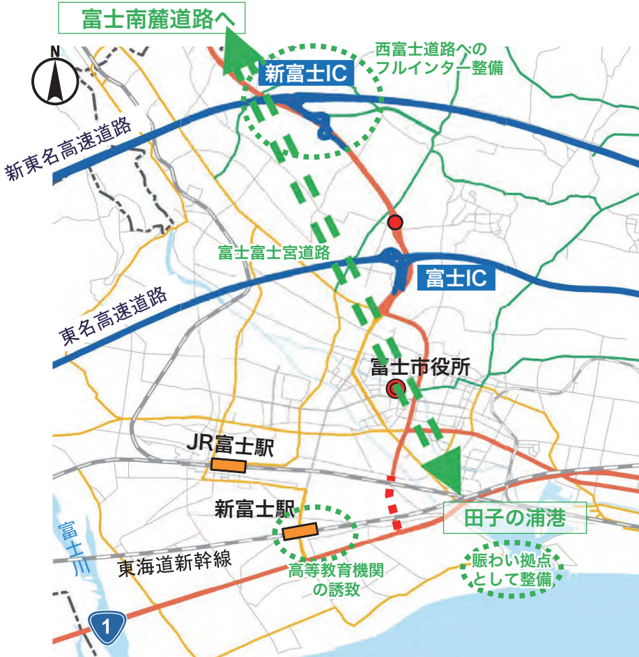
静岡県への要望事業 (イメージ図)