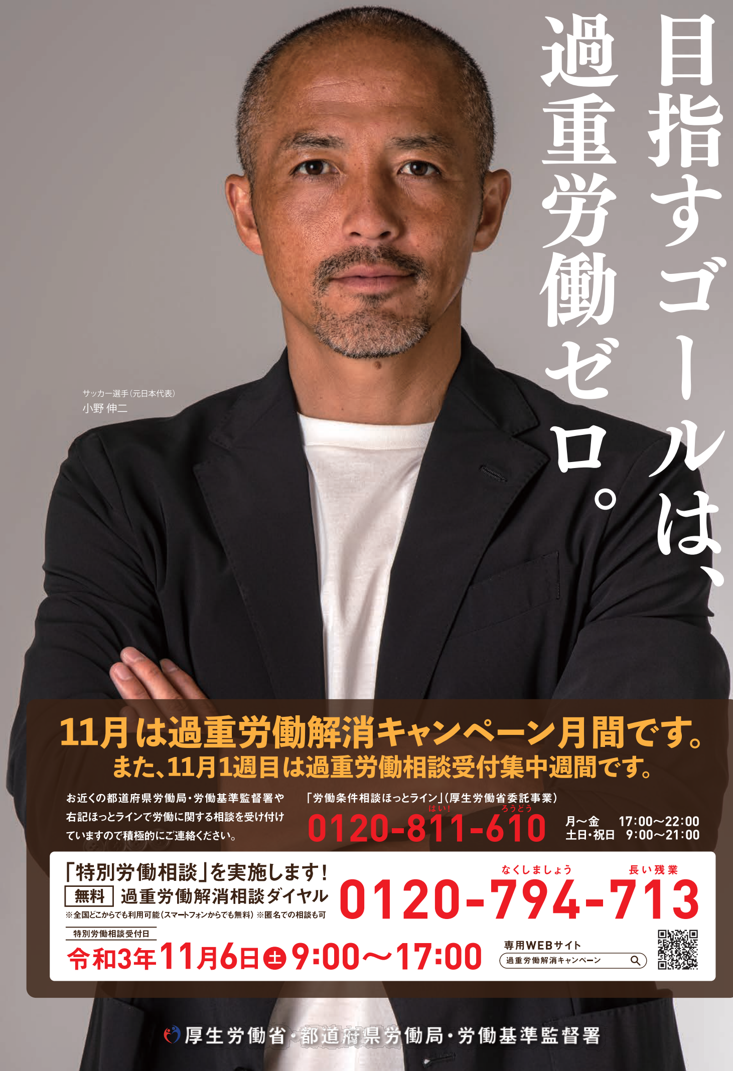
サッカー選手(元日本代表) 小野 伸二