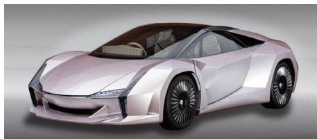
ナノセルロースヴィークル 環境省