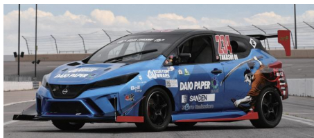
SAMURAI SPEED 大王製紙株式会社