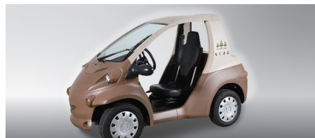
もくまる トヨタ車体株式会社