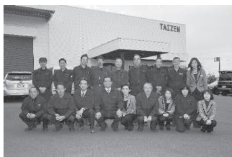
少人数で大きなプロジェクトを回すため、一体感がすごい。あなたも仲間になって、やりがいのある仕事でキャリアをつみませんか。