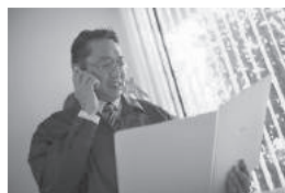
お客様の課題を見つけることから、解決策を提案して施工するところまで、お客様に密着して営業活動を行うことで、信頼関係を築いています。