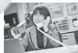
普段は研究の仕事をしています。今は営業サポートに入っています。ローテーションはスキルアップのため成長している自分を実感できます。