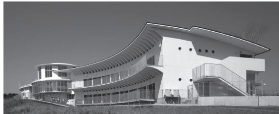
▲みのるこども園様

全社員「誠実施工と安全管理」並びに「お客様とのコミュニケーション」の一貫した姿勢で多くの皆様の賛同と信頼を頂けるよう頑張っております。